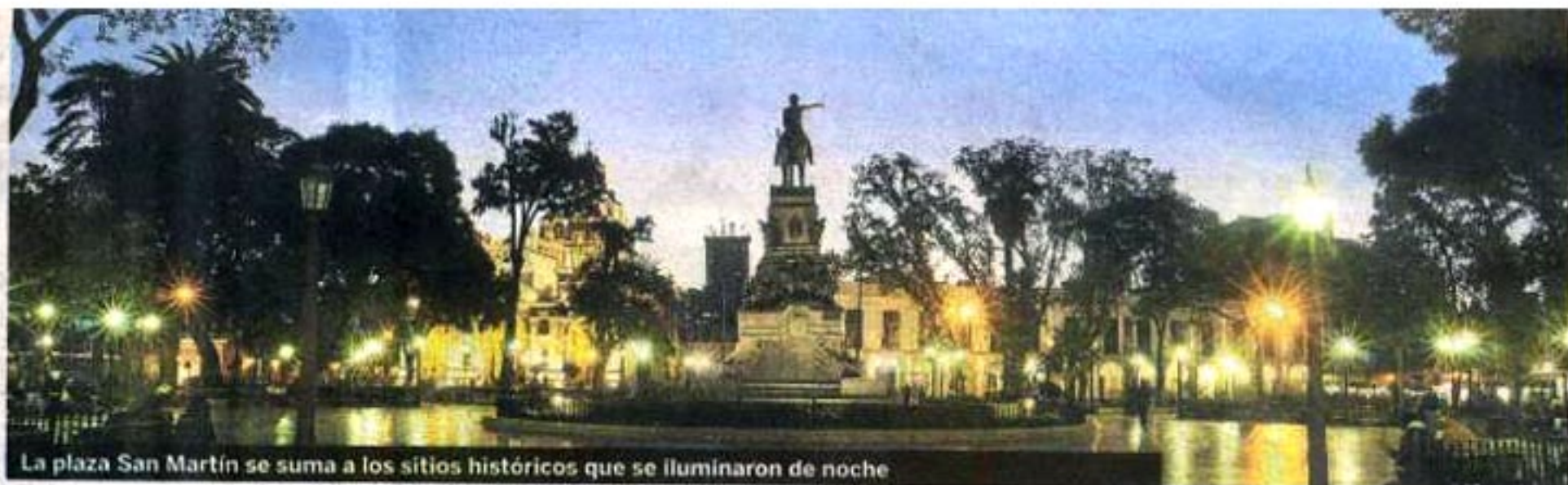
La plaza San Martín se suma a los sitios históricos que se iluminaron de noche

"El turista es el colado de la fiesta", acusa el actor. PÁGINA 7