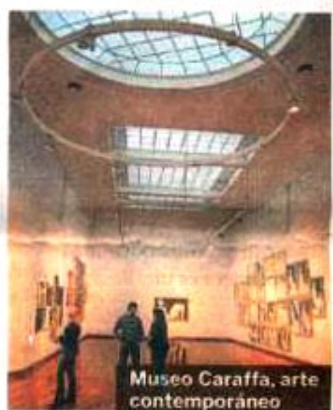
Museo Caraffa, arte contemporáneo