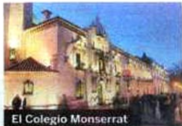
El Colegio Monserrat