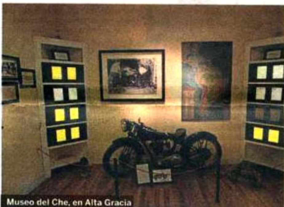
Museo del Che, en Alta Gracia