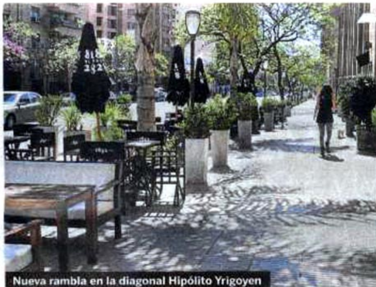
Nueva rambla en la diagonal Hipólito Yrigoyen

la Agencia Córdoba Turismo y otros organismos de gobierno.